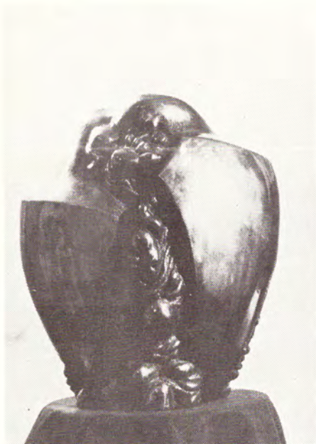
Labat Vladimir »Metamorfoza II