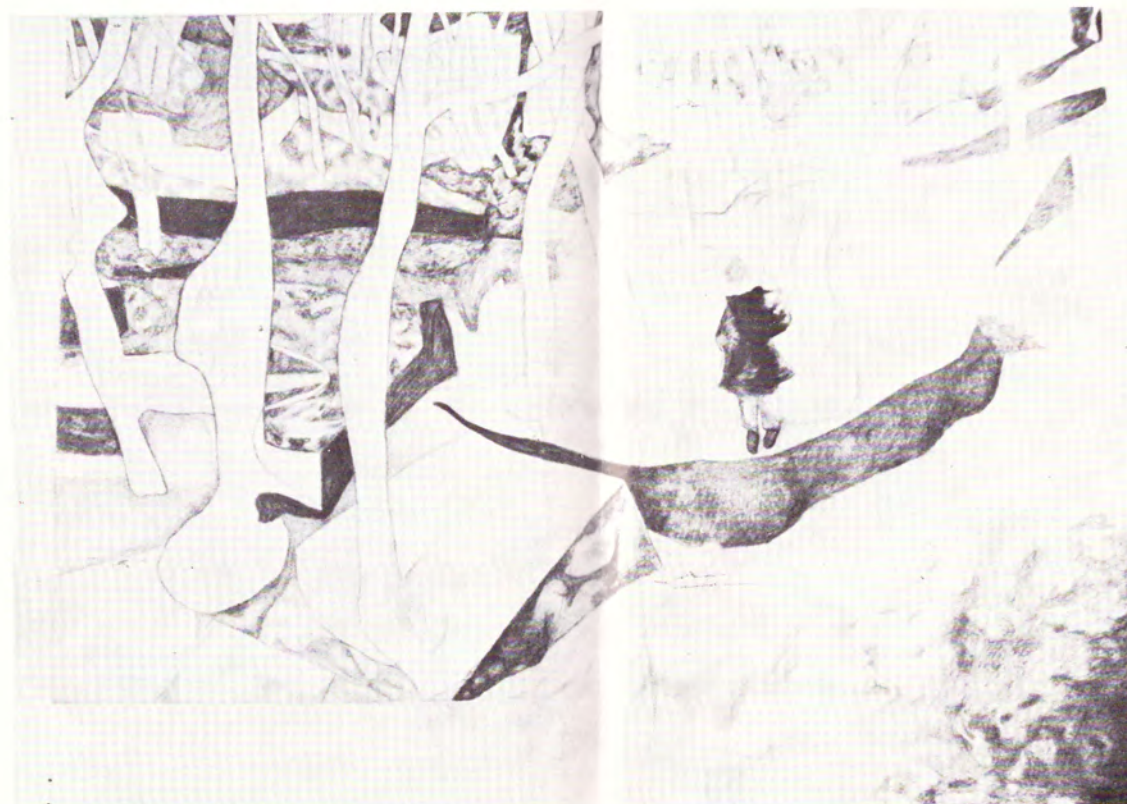
RESTORAN „BORIK“ NA MORU SA ŽENSKOM FIGUROM

Štampa i klišeji: „Forum“, Novi Sad, Vojvode Mišića 1 Likovna oprema: Laslo Kapitanj Tiraž: 350 primeraka