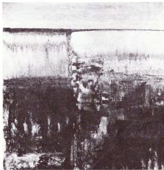
Polje II, 1970.

Nagrade: 1961, nagrada umetničke kolonije Ečka, 1967. nagrada izdavačkog preduzeća „Forum“, 1968. Oktobarska nagrada grada Novog Sada, 1968. nagrada Umetničke kolonije Bečej.